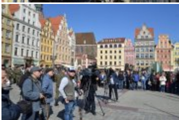
Uczestnicy wojskowego pikniku