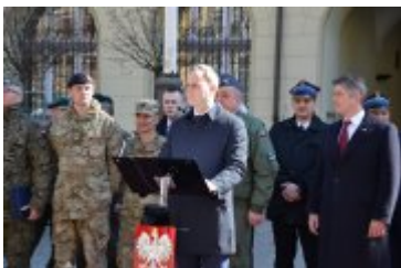
Wojewoda Dolnośląski wita uczestników wojskowego pikniku na wrocławskim Rynku

Do godz. 16:00 wrocławianie będą mieli okazję zobaczyć m.in. amerykańskie transportery opancerzone Stryker, brytyjskie pojazdy rozpoznawcze Jackal oraz sprzęt i wyposażenie jednostek i instytucji wojskowych Garnizonu Wrocław. Prezentacjom sprzętu wojskowego będą towarzyszyły pokazy musztry paradnej oraz walki wręcz. Spotkanie uświetni występ Orkiestry Reprezentacyjnej Wojsk Lądowych.