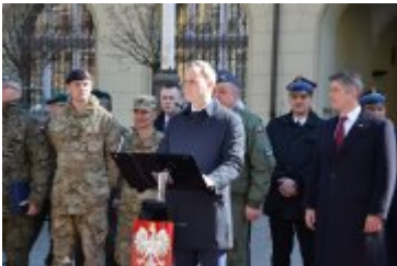
Wojewoda Dolnośląski wita uczestników wojskowego pikniku na wrocławskim Rynku

Do godz. 16:00 wrocławianie będą mieli okazję zobaczyć m.in. amerykańskie transportery opancerzone Stryker, brytyjskie pojazdy rozpoznawcze Jackal oraz sprzęt i wyposażenie jednostek i instytucji wojskowych Garnizonu Wrocław. Prezentacjom sprzętu wojskowego będą towarzyszyły pokazy musztry paradnej oraz walki wręcz. Spotkanie uświetni występ Orkiestry Reprezentacyjnej Wojsk Lądowych.