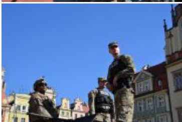
Żołnierze wojsk NATO na wrocławskim Rynku