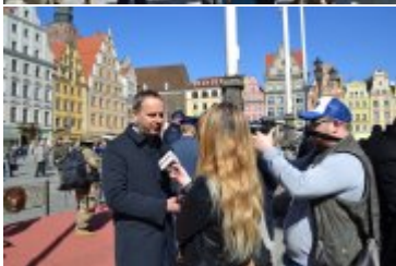
Wojewoda Paweł Hreniak udziela wywiadu