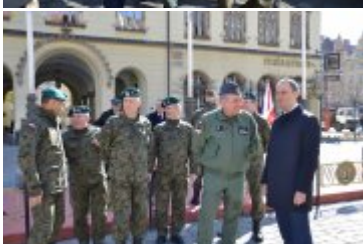
Wojewoda Dolnośląski podczas pikniku w ramach przemieszczenia wojsk NATO