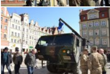
Prezentacja sprzętu wojskowego na wrocławskim Rynku