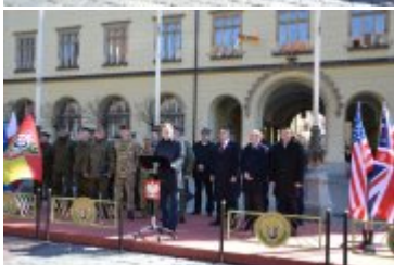
Wystąpienie Wojewody Dolnośląskiego