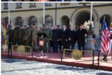
Uroczyste otwarcie wojskowego pikniku na wrocławskim Rynku