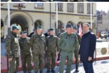
Wojewoda Dolnośląski podczas pikniku w ramach przemieszczenia wojsk NATO