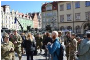
Piknik wojskowy na wrocławskim Rynku