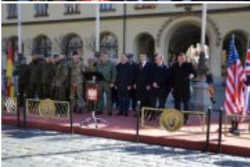
Uroczyste otwarcie wojskowego pikniku na wrocławskim Rynku