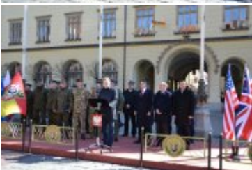
Wystąpienie Wojewody Dolnośląskiego