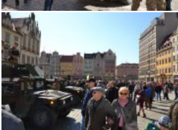
Wojskowy piknik na wrocławskim Rynku