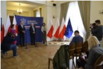
Konferencja prasowa poświęcona budowie stopnia wodnego w Malczycach