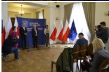
Konferencja prasowa poświęcona budowie stopnia wodnego w Malczycach