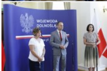
Konferencja prasowa w Dolnośląskim Urzędzie Wojewódzkim