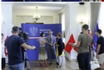
Konferencja prasowa w Dolnośląskim Urzędzie Wojewódzkim