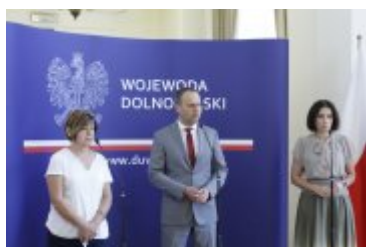
Wojewoda Dolnośląski podczas konferencji prasowej