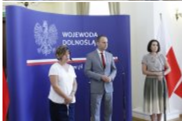
Konferencja prasowa w Dolnośląskim Urzędzie Wojewódzkim