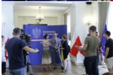
Konferencja prasowa w Dolnośląskim Urzędzie Wojewódzkim