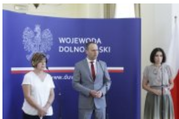
Wojewoda Dolnośląski podczas konferencji prasowej