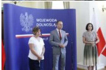
Konferencja prasowa w Dolnośląskim Urzędzie Wojewódzkim