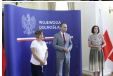
Konferencja prasowa w Dolnośląskim Urzędzie Wojewódzkim