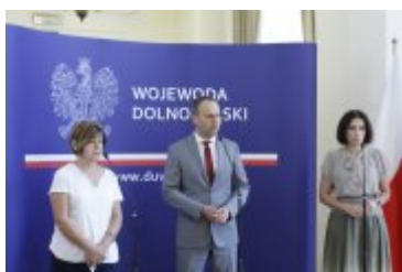
Wojewoda Dolnośląski podczas konferencji prasowej