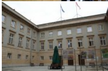
Wewnętrzny dziedziniec Dolnośląskiego Urzędu Wojewódzkiego, w którym powstanie nowe centrum obsługi klientów paszportowych i cudzoziemców