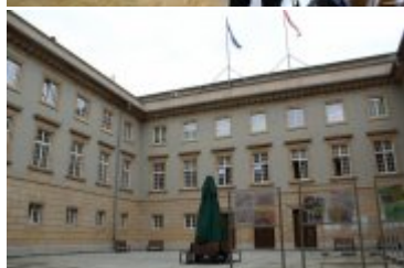
Wewnętrzny dziedziniec Dolnośląskiego Urzędu Wojewódzkiego, w którym powstanie nowe centrum obsługi klientów paszportowych i cudzoziemców