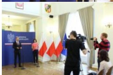
Konferencja prasowa w Dolnośląskim Urzędzie Wojewódzkim