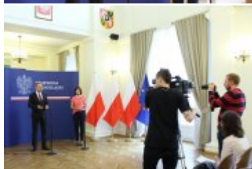
Konferencja prasowa w Dolnośląskim Urzędzie Wojewódzkim