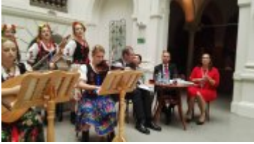
Narodowe Czytanie Wesela w Muzeum Narodowym we Wrocławiu