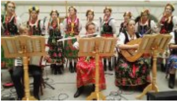
Występy artystyczne podczas Narodowego Czytania w Muzeum Narodowym