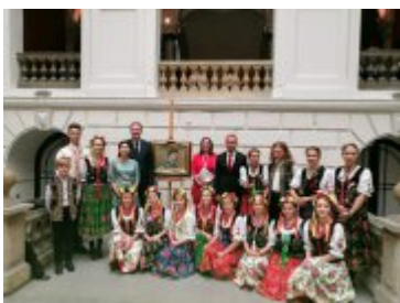
Wojewoda Dolnośląski z artystami w Muzeum Narodowym we Wrocławiu

Po zakończeniu czytania uczestnicy mieli też okazję zobaczyć obrazy Stanisława Wyspiańskiego oraz wątki ludowe w dziełach innych malarzy polskich przełomu XIX i XX wieku, w kolekcji Muzeum Narodowego we Wrocławiu. Akcję Honorowym Patronatem objęła Para Prezydencka.