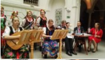
Narodowe Czytanie Wesela i przerwa muzyczna w Muzeum Narodowym we Wrocławiu