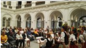
Publiczność słucha Narodowego Czytania Wesele w Muzeum Narodowym we Wrocławiu