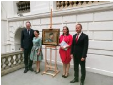
Uczestnicy Narodowego Czytania w Muzeum Narodowym we Wrocławiu