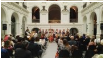
Uczestnicy słuchają Wesele podczas Narodowego Czytania