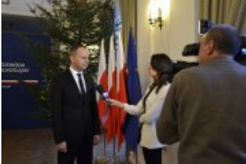
Wojewoda udziela wywiadu