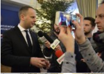
Wojewoda rozmawia z dziennikarzami