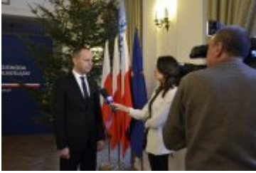
Wojewoda udziela wywiadu