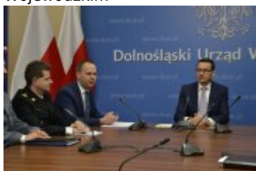
Wojewoda Dolnośląski przedstawia Premierowi raport z akcji ratunkowej w Mirsku