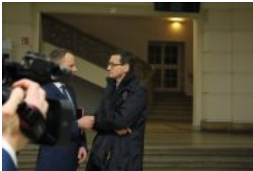
Wojewoda Dolnośląski rozmawia z Premierem Mateuszem Morawieckim