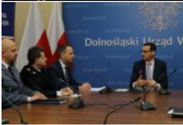
Spotkanie z Premierem RP Mateuszem Morawieckim