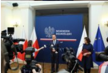
Wojewoda Dolnośląski podczas konferencji prasowej