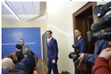
Premier RP z Wojewodą Dolnośląskim witają przedstawicieli służb