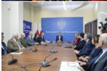
Premier RP podczas spotkania z przedstawicielami służb w Dolnośląskim Urzędzie Wojewódzkim