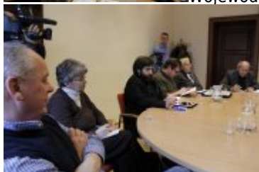
Uczestnicy spotkania z Wojewodą Dolnośląskim