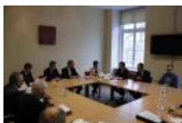
Wojewoda Dolnośląski podczas spotkania z Akcją Lokatorską