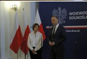
Wystąpienie Wojewody Dolnośląskiego podczas konferencji prasowej