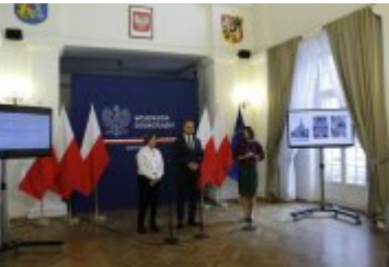
Konferencja prasowa na temat dotacji na dolnośląskie zabytki

załączeniu publikujemy prezentację wybranych zabytków z Dolnego Śląska, które otrzymały dotację.