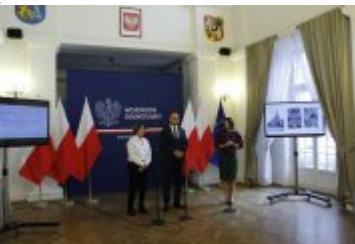
Konferencja prasowa na temat dotacji na dolnośląskie zabytki

załączeniu publikujemy prezentację wybranych zabytków z Dolnego Śląska, które otrzymały dotację.