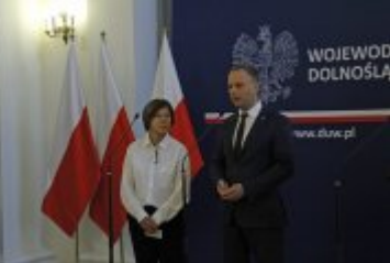
Wystąpienie Wojewody Dolnośląskiego podczas konferencji prasowej