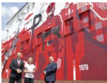
Wojewoda Dolnośląski z Dyrektorem Oddziału IPN we Wrocławiu przed murem

Mural upamiętnia najważniejsze dokonania Polaków w walce o niepodległość państwową i wolność obywateli. W ciągu ostatniego stulecia zmagania o te wartości toczono najpierw z zaborcami, a następnie z dwoma totalitaryzmami: nazistowskim i komunistycznym. Walka ta zakończyła się sukcesem, zyskała uznanie innych narodów, a dla wielu z nich stała się inspiracją w poszukiwaniach własnej drogi do wolności. Mural ukazuje w sposób symboliczny nasze przejścia od roku 1918 do dnia dzisiejszego, w którym możemy cieszyć się niezależnością i osiągnięciami współczesności.