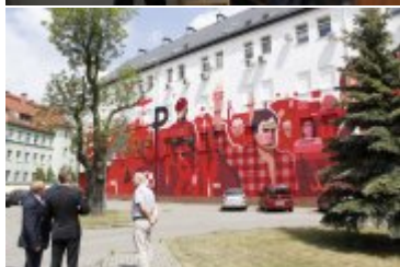
Wojewoda Dolnośląski ogląda mural #PokoleniaNiepodległej