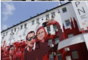
Mural historyczny #PokoleniaNiepodległej