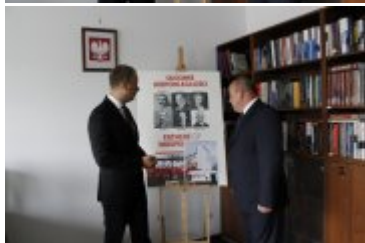
Wojewoda Dolnośląski z Dyrektorem Oddziału Instytutu Pamięci Narodowej we Wrocławiu