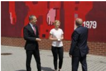
Wojewoda Dolnośląski z Dyrektorem Oddziału IPN przed murałem historycznym