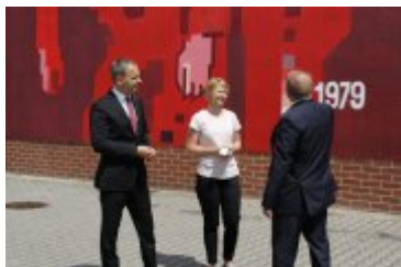
Wojewoda Dolnośląski z Dyrektorem Oddziału IPN przed murałem historycznym