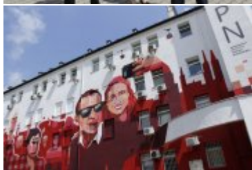
Mural historyczny #PokoleniaNiepodległej