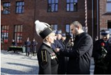
Wojewoda wręcza odznaczenia państwowe