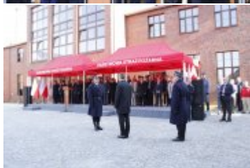
Składanie meldunku o rozpoczęciu uroczystości