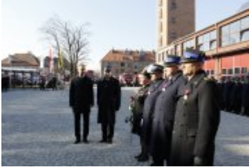
Wojewoda wręcza odznaczenia państwowe