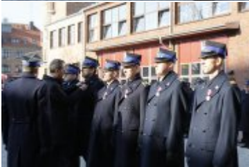
Wojewoda wręcza odznaczenia państwowe