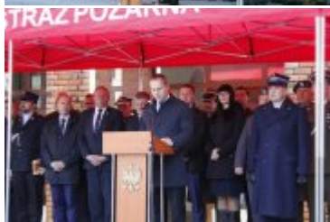
Wojewoda odczytuje list Premiera RP Mateusza Morawieckiego