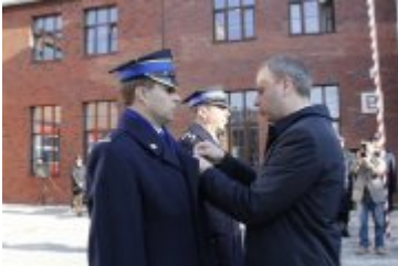
Wojewoda wręcza odznaczenia państwowe