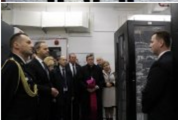
Zwiedzanie nowo otwartego Centrum Zarządzania Bezpieczeństwem Województwa Dolnośląskiego