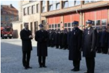
Wojewoda wręcza odznaczenia państwowe