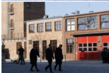
Składanie meldunku o rozpoczęciu uroczystości