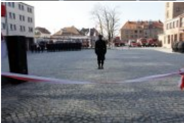
Otwarcie Centrum Zarządzania Bezpieczeństwem Województwa Dolnośląskiego