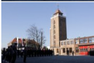
Otwarcie Centrum Zarządzania Bezpieczeństwem Województwa Dolnośląskiego