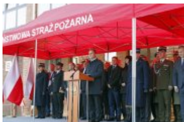
Wystąpienie Wojewody Dolnośląskiego

Podczas wydarzenia Wojewoda odczytał list Prezesa Rady Ministrów Mateusza Morawieckiego skierowany do uczestników uroczystości.