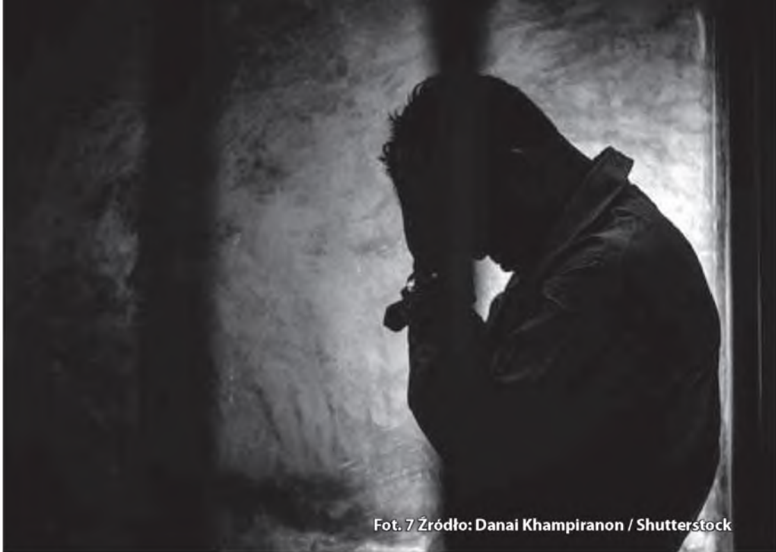
Fot. 7

Zgodnie z art. 35 ust. 1 ustawy o ochronie zwierząt, przestępstwo polegające na zabijaniu, uśmiercaniu lub uboju zwierząt z naruszeniem przepisów ustawy zagrożone jest obecnie karą pozbawienia wolności do lat 3. Tej samej karze podlega ten, kto znęca się nad zwierzęciem (art. 35 ust. 1a). Jeżeli sprawca czynu określonego w ust. 1 lub 1a działa ze szczególnym okrucieństwem, podlega karze pozbawienia wolności od 3 miesięcy do lat 5 (art. 35 ust. 2). Przed nowelizacją przestępstwo z art. 35 ust. 1 i 35 ust. 1a ustawy o ochronie zwierząt było zagrożone grzywną, karą ograniczenia wolności lub karą do 2 lat pozbawienia wolności, zaś za działanie sprawcy ze szczególnym okrucieństwem groziła kara do 3 lat pozbawienia wolności.