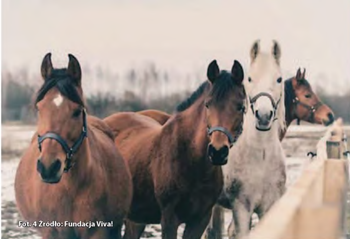
Fot. 4