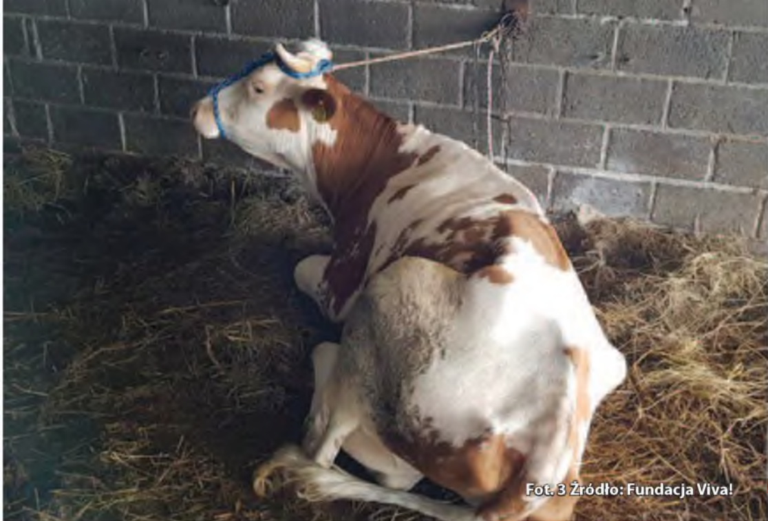
Fot. 3

Coraz częstszą negatywną praktyką organów administracyjnych jest wstrzymywanie się z wydaniem decyzji kosztowej do czasu prawomocnego rozstrzygnięcia sprawy karnej. Jest to postępowanie nieprawidłowe, postępowania karne niejednokrotnie trwają bowiem po kilka lat, a takie praktyki organów pozbawiają organizacje możliwości uzyskania środków na utrzymanie zwierzęcia, które często są bardzo wysokie i muszą być stale ponoszone.