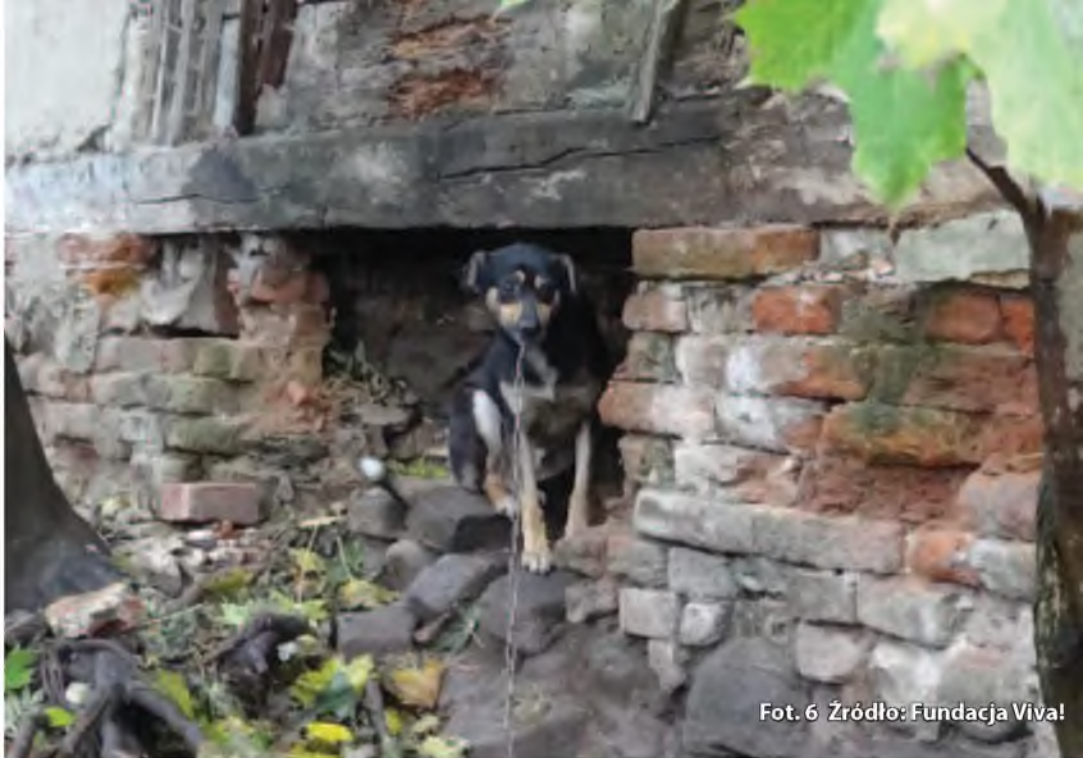
Fot. 6

Zwierzęta powinny być zabezpieczone jako dowody rzeczowe w sprawie, zarówno z uwagi na fakt, że mogą stanowić dowód (mogą być poddawane oględzinom, badaniom biegłego lekarza weterynarii czy biegłego zoopsychologa), jak również dlatego, że w przypadku skazania właściciela za popełnienie przestępstwa znęcania się nad nimi będą podlegały obowiązkowemu przepadkowi na podstawie art. 35 ust. 3 ustawy o ochronie zwierząt.