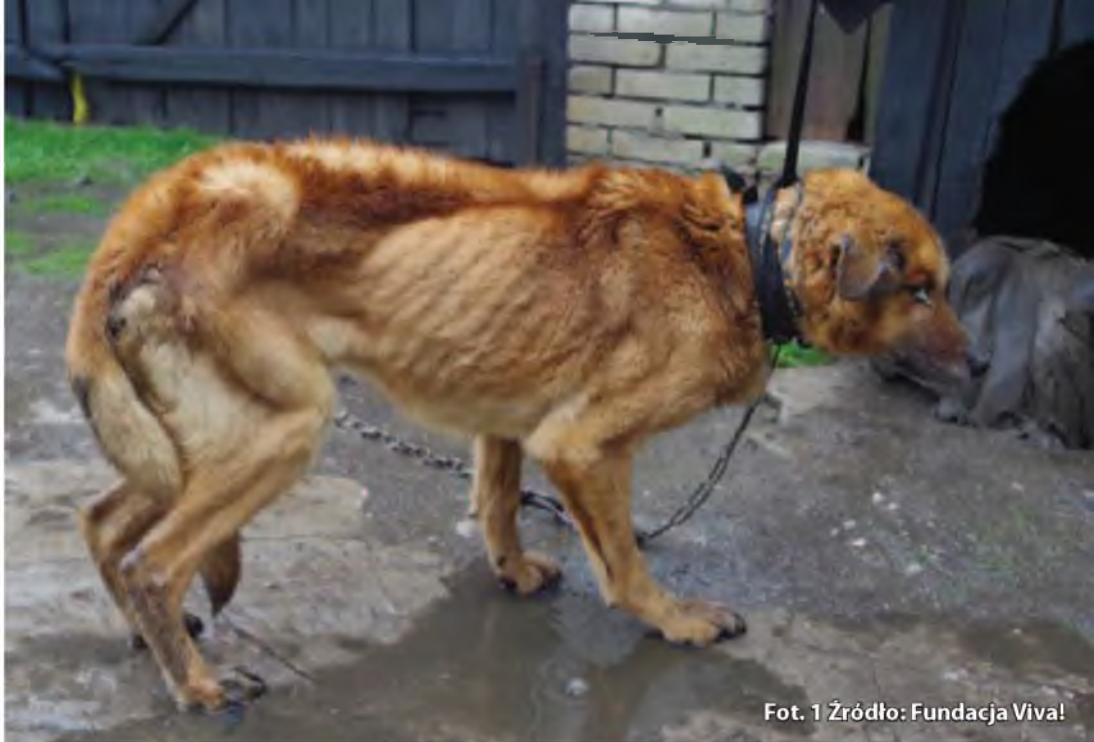
Fot. 1

Najczęstszym błędem w rozumieniu pojęcia „znęcania się” nad zwierzętami jest definiowanie go jako działania intencjonalnego sprawcy, ukierunkowanego na chęć zadawania bólu lub cierpienia. Takie rozumowanie jest nieprawidłowe, zamiar sprawcy nie odnosi się bowiem do samego zadawania zwierzęciu bólu lub cierpienia, lecz do czynności sprawczej.