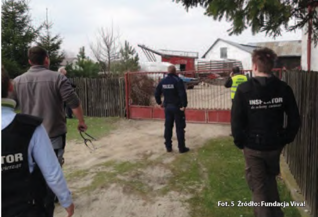
Fot. 5

Szczególnie w przypadkach niecierpiących zwłoki funkcjonariusze Policji mają prawo stosować wszelkie środki w granicach swoich uprawnień, celem zabezpieczenia zwierzęcia oraz innych dowodów w sprawie. Zatrzymania zwierzęcia oraz innych dowodów rzeczowych przedstawiciele Policji mają prawo dokonać za okazaniem legitymacji służbowej.