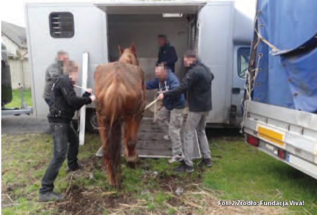
Fot. 2

W trybie zwykłym zwierzę odbierane jest na podstawie decyzji administracyjnej, kiedy padło ofiarą znęcania się, ale nie znajduje się w stanie bezpośredniego zagrożenia życia ani zdrowia. W trybie interwencyjnym zwierzę najpierw jest odbierane, kiedy spełnione są łącznie dwie przesłanki: zwierzę jest traktowane w sposób określony w art. 6 ust. 2 ustawy o ochronie zwierząt (znęcanie się) oraz dalsze pozostawanie zwierzęcia u dotychczasowego właściciela lub opiekuna zagraża jego życiu lub zdrowiu.