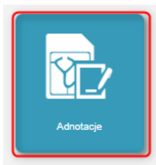
Rysunek 4 Kafelki 'Adnotacje'

W celu wprowadzenia informacji dotyczących adnotacji konieczne jest użycie kafelka 'Adnotacje' .