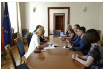
Spotkanie z przedstawicielami Starostwa Powiatowego w Kłodzku