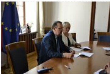
Przedstawiciele Starostwa Powiatowego w Kłodzku