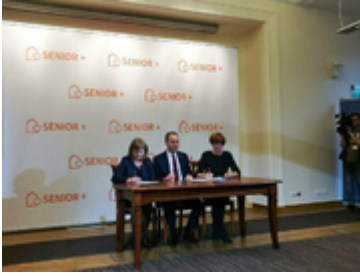
Podpisanie umów w ramach programu Senior Plus w Ministerstwie Rodziny, Pracy i Polityki Społecznej