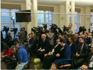
Uroczystość podpisania umów na dofinansowanie w ramach programu Senior Plus