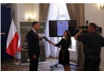
Konferencja prasowa zapowiadająca uroczystości