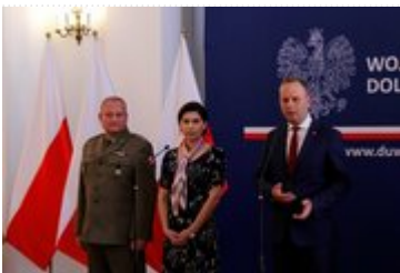
Konferencja prasowa dotycząca obchodów 2 maja we Wrocławiu