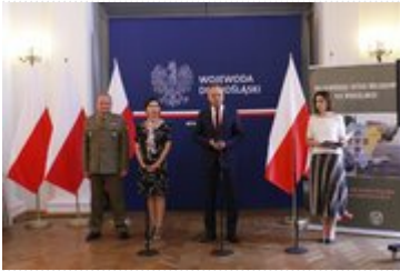
Wojewoda Dolnośląski Paweł Hreniak podczas konferencji