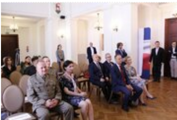
Uczestnicy konferencji prasowej