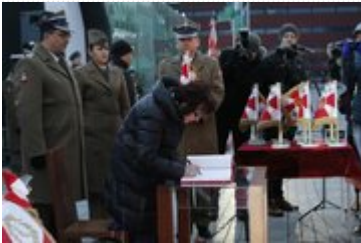
Uroczystość wręczenia nowego sztandaru Akademii Wojsk Lądowych