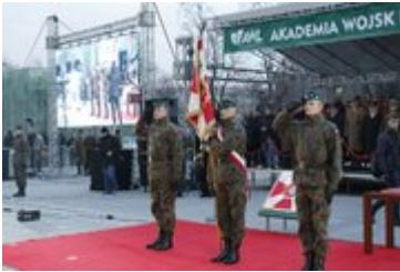
Uroczystość wręczenia nowego sztandaru Akademii Wojsk Lądowych