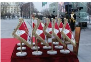
Uroczystość wręczenia nowego sztandaru Akademii Wojsk Lądowych