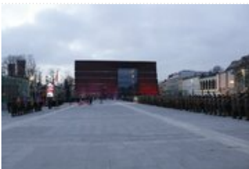
Uroczystość wręczenia nowego sztandaru Akademii Wojsk Lądowych