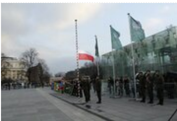
Uroczystość wręczenia nowego sztandaru Akademii Wojsk Lądowych