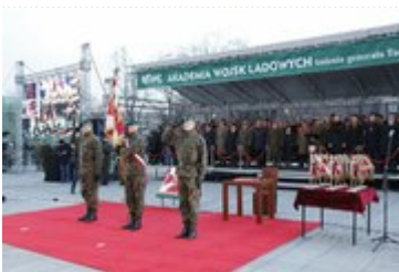
Uroczystość wręczenia nowego sztandaru Akademii Wojsk Lądowych