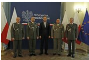
Wizyta przedstawicieli Centrum Szkolenia Wojsk Inżynieryjnych i Chemicznych

Wojewoda złożył także życzenia z okazji przypadającego na 16 kwietnia Dnia Sapera.