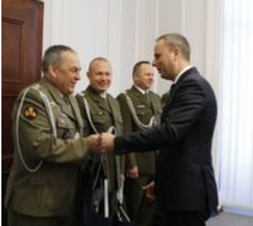
Wizyta przedstawicieli Centrum Szkolenia Wojsk Inżynieryjnych i Chemicznych