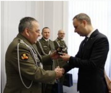
Wizyta przedstawicieli Centrum Szkolenia Wojsk Inżynieryjnych i Chemicznych