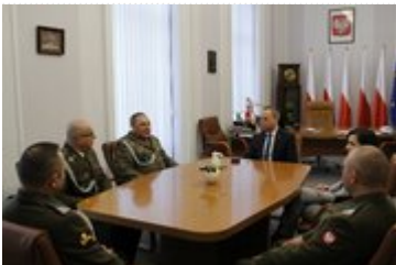
Wizyta przedstawicieli Centrum Szkolenia Wojsk Inżynieryjnych i Chemicznych