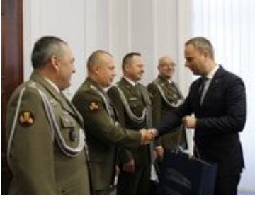
Wizyta przedstawicieli Centrum Szkolenia Wojsk Inżynieryjnych i Chemicznych