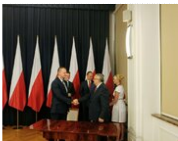
Porozumienie w sprawie Funduszu Rozwoju Przewozów Autobusowych