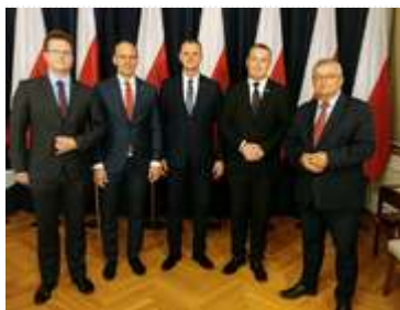
Porozumienie w sprawie Funduszu Rozwoju Przewozów Autobusowych

Jednocześnie organizator (samorząd terytorialny) będzie zobowiązany dopłacić do kwoty deficytu na danej linii komunikacyjnej nie mniej niż 10 proc. ze środków własnych.