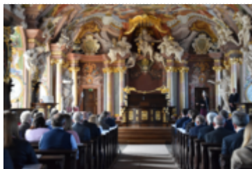
Prace konserwatorskie wnętrza trwały sześć lat