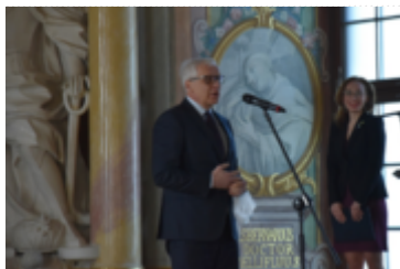
Ponowne otwarcie Auli Leopoldyńskiej