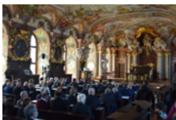
XVIII-wieczna Aula Leopoldyńska to jedna z najpiękniejszych sal barokowych na świecie

Została wzniesiona w latach 1728-1732 i nazwana ku czci cesarza Leopolda I. W ramach prowadzonych przez sześć lat prac konserwatorskich odnowiono freski, sztukaterie, elementy podium wraz z rzeźbami oraz emporę, wymieniono okna, renowację przeszły także obrazy, łoże oraz ławki.