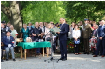
Poseł na Sejm RP Paweł Hreniak