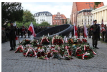
Obchody 78. rocznicy wybuchu Powstania Warszawskiego