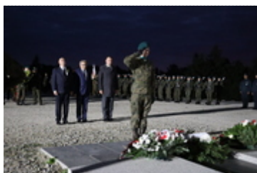
Cmentarz Żołnierzy Wojska Polskiego we Wrocławiu