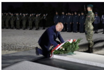
W podniosłej uroczystości wziął udział Jarosław Kresa - wicewojewoda dolnośląski