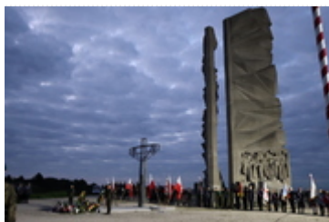
Obchody 83. rocznicy wybuchu II wojny światowej

1 września 1939 roku wojska niemieckie bez wypowiedzenia wojny przekroczyły o świcie granice Rzeczypospolitej, rozpoczynając tym samym pierwszą kampanię II wojny światowej. O godzinie 4.35 przeprowadzono zbombardowanie Wielunia. Atak ten nastąpił kilka minut przed salwami pancernika „Schleswig-Holstein” oddanymi w kierunku Westerplatte. II wojna światowa była największą i najkrwawszą wojną w historii ludzkości, w której Polska poniosła największe straty i szkody demograficzne spośród wszystkich państw walczących i okupowanych.