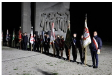
Obchody 83. rocznicy wybuchu II wojny światowej