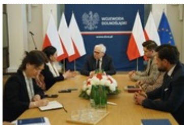
Spotkanie Wojewody Dolnośląskiego z nową Ambasador Gruzji

Gruzja to piękny kraj, który cieszy się popularnością wśród Polaków. W naszym województwie szacuje się, że mieszka ponad 10 tysięcy Gruzinów.