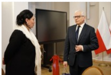
Spotkanie Wojewody Dolnośląskiego z nową Ambasador Gruzji