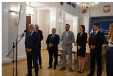
Konferencja prasowa oraz pierwsze posiedzenie powołanego Interdyscyplinarnego Zespołu do spraw projektu firmy „Intel” obejmującego stworzenie Zakładu Integracji i Testowania Półprzewodników w województwie dolnośląskim.