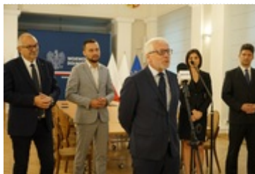
Konferencja prasowa oraz pierwsze posiedzenie powołanego Interdyscyplinarnego Zespołu do spraw projektu firmy „Intel” obejmującego stworzenie Zakładu Integracji i Testowania Półprzewodników w województwie dolnośląskim. 2

Intel działa już w Polsce od wielu lat. Wykonuje prace w zakresie badań i rozwoju w Gdańsku, gdzie znajduje się największy ośrodek tego typu w Europie, w którym pracuje blisko 4 tys. osób.