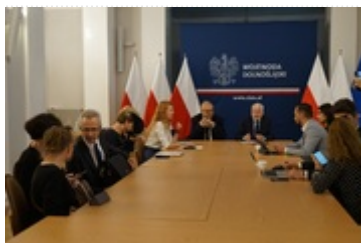
Konferencja prasowa oraz pierwsze posiedzenie powołanego Interdyscyplinarnego Zespołu do spraw projektu firmy „Intel” obejmującego stworzenie Zakładu Integracji i Testowania Półprzewodników w województwie dolnośląskim. 4