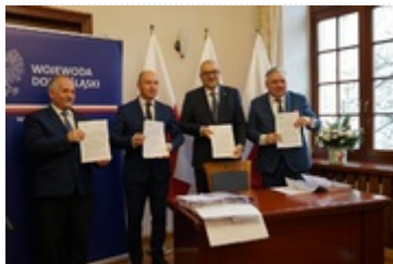
Prezentacja podpisanej decyzji