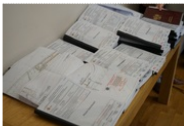
Dokumentacja ws. budowy drogi