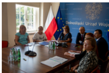
Spotkanie 29082024 (1)

Efektywne wykorzystanie wewnętrznego potencjału Dolnego Śląska i jego specjalizacji dla osiągnięcia zrównoważonego rozwoju kraju może tworzyć warunki do wzrostu dochodów mieszkańców regionu. To wszystko przy jednoczesnym osiągnięciu spójności w wymiarze społecznym, gospodarczym, środowiskowym czy przestrzennym.