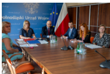
Spotkanie 29082024 (5)