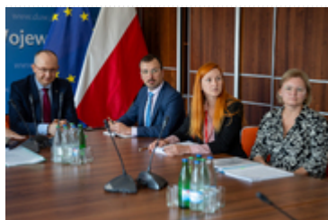
Spotkanie 29082024 (7)