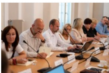
Spotkanie DWRM NIE i Pełnomocników wojewodów ds. mniejszości narodowych i etnicznych 04.09.2024-10