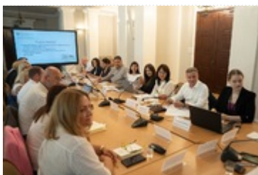
Spotkanie DWRM NIE i Pełnomocników wojewodów ds. mniejszości narodowych i etnicznych 04.09.2024-11