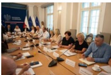
Spotkanie DWRM NIE i Pełnomocników wojewodów ds. mniejszości narodowych i etnicznych 04.09.2024-9